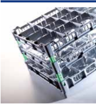
Rack-Systeme 400 x 400 für kleinere Spülmaschinen im Untertischbereich

Informieren Sie sich über die Vielfalt unserer Produkte.