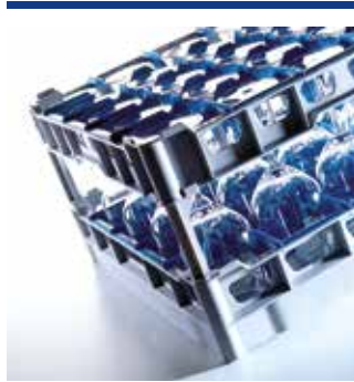
Rack-Systeme 500 x 500 für den Gastro-Bereich