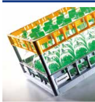
Rack-Systeme 600 x 400 für den Logistik- und Cateringbereich