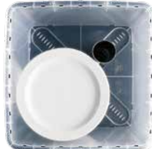
ca. 24 Teller Ø 26 cm