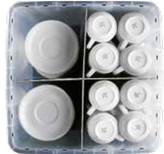
ca. 56 Tassen und Unterteller