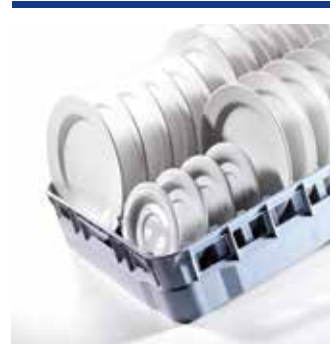
Rack-Systeme 600 x 500 für große Hauben- und Korbdurch- laufmaschinen