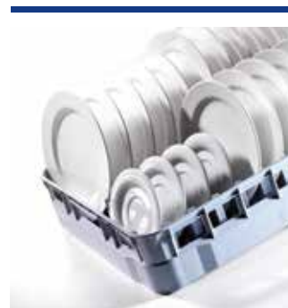
Sistemi rack 600 x 500 per grandi convogliatrici a calotta e a cestello