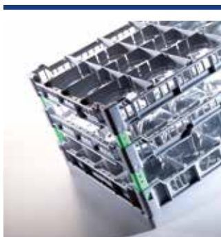
Sistemi rack 400 x 400 per le lavastoviglie più piccole sotto il bancone

Informatevi sulla varietà dei nostri prodotti.