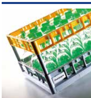
Sistemi rack 600 x 400 per logistica e catering