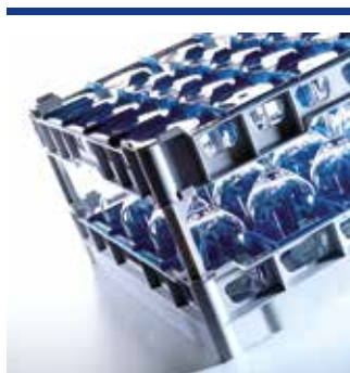
Sistemi rack 500 x 500 per la gastronomia