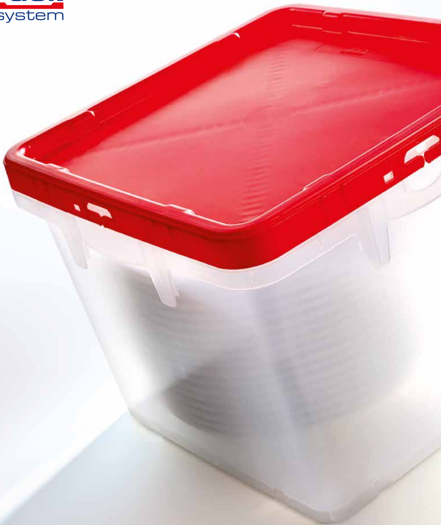
BOX DA TRASPORTO ED EVENTPLATE