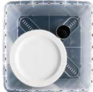
aprox. 24 platos de Ø 26 cm