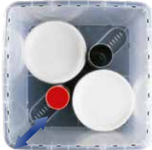
aprox. 60 platos de Ø 19 cm

Gracias al elemento Vary-Tool y las divisiones, podrá transportar platos de diferentes medidas, tazas, vajilla en general de manera segura y cómoda. Al cerrar con la tapa se fija el Vary-Tool.