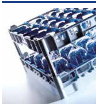
Rack-Systeme 500 x 500 für den Gastro-Bereich