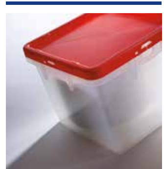
Gastro & Catering Geschirrtransportbox und Partyteller