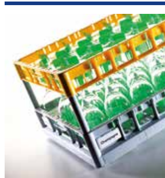
Rack-Systeme 600 x 400 für den Logistik- und Cateringbereich