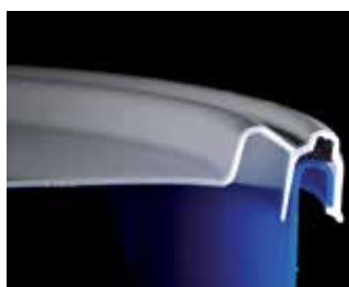
Optional: wasserdichter Deckel