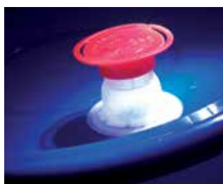
Optional: ausziehbarer Ausgießer