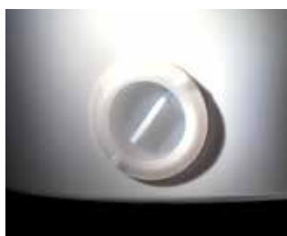
Optional: Untenausguss (KALTEX)