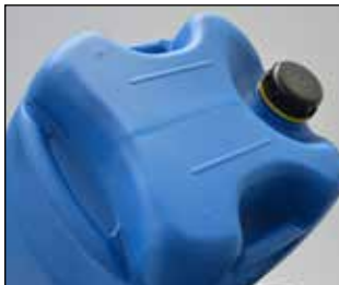
3-Griff auf einer Ebene