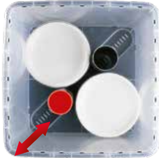
aprox. 60 platos de Ø 19 cm

Gracias al elemento Vary-Tool y las divisiones, podrá transportar platos de diferentes medidas, tazas, vajilla en general de manera segura y cómoda. Al cerrar con la tapa se fija el Vary-Tool.